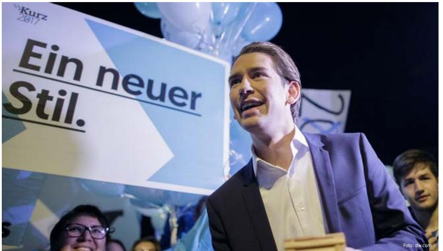
2017: Neue Farbe, neuer Stil, frisches Gesicht. Sebastian Kurz übernimmt Partei und Kanzleramt.

Mit einem stramm konservativen Kurs und neuen Gesichtern in der „türkisen Clique“ gelang ihm der Durchmarsch. Sebastian Kurz scheute sich nicht, mit der rechtspopulistischen FPÖ in ein politi-