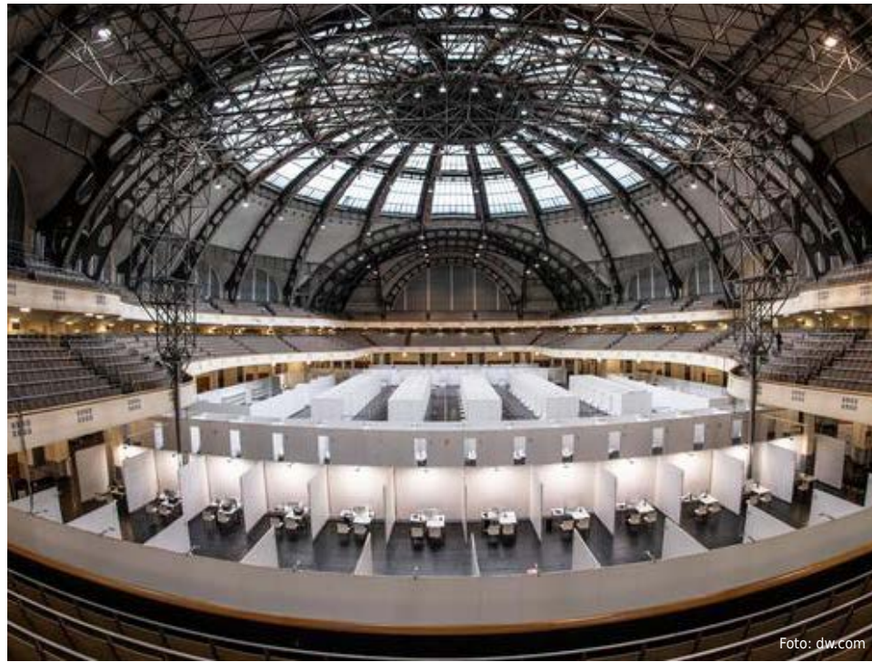
Es sieht perfekt aus: Nirgendwo kann in schönerem Umfeld geimpft werden als in Frankfurt am Main. Nur der Impfstoff ließ auf sich warten

Der neue Berliner Flughafen ist dafür ein gutes Beispiel. Mit viel Trara wurde eine Entrauchungsanlage in Aussicht gestellt, die es weltweit so noch nicht gab, und die dann nie funktionierte. Dazu kamen ständige Sonderwünsche der Politik. Ergebnis: Erst seit kurzem ist der neue Airport fertig, um Jahre verspätet und für ein Vielfaches des