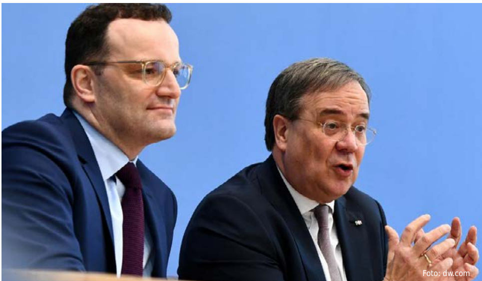
Führen als Tandem die CDU: Spahn und Laschet

Friedrich Merz wollte weder als stellvertretender Vorsitzender noch als Präsidiumsmitglied noch für ein weiteres Führungsgremium der CDU kandidieren. Aber noch vor Ende des Parteitags meldete sich der 65-jährige per Twitter zu Wort. Er habe Laschet angeboten, „in die jetzige Bundesregierung einzutreten und das Bundeswirtschaftsministerium zu übernehmen“. Ein Ministerium, das seit langem vom Merkel-Vertrauten Peter Altmaier (62) geführt wird... Der erste digitale Parteitag der CDU ist Geschichte. Die Debatten um Friedrich Merz werden andauern. ■