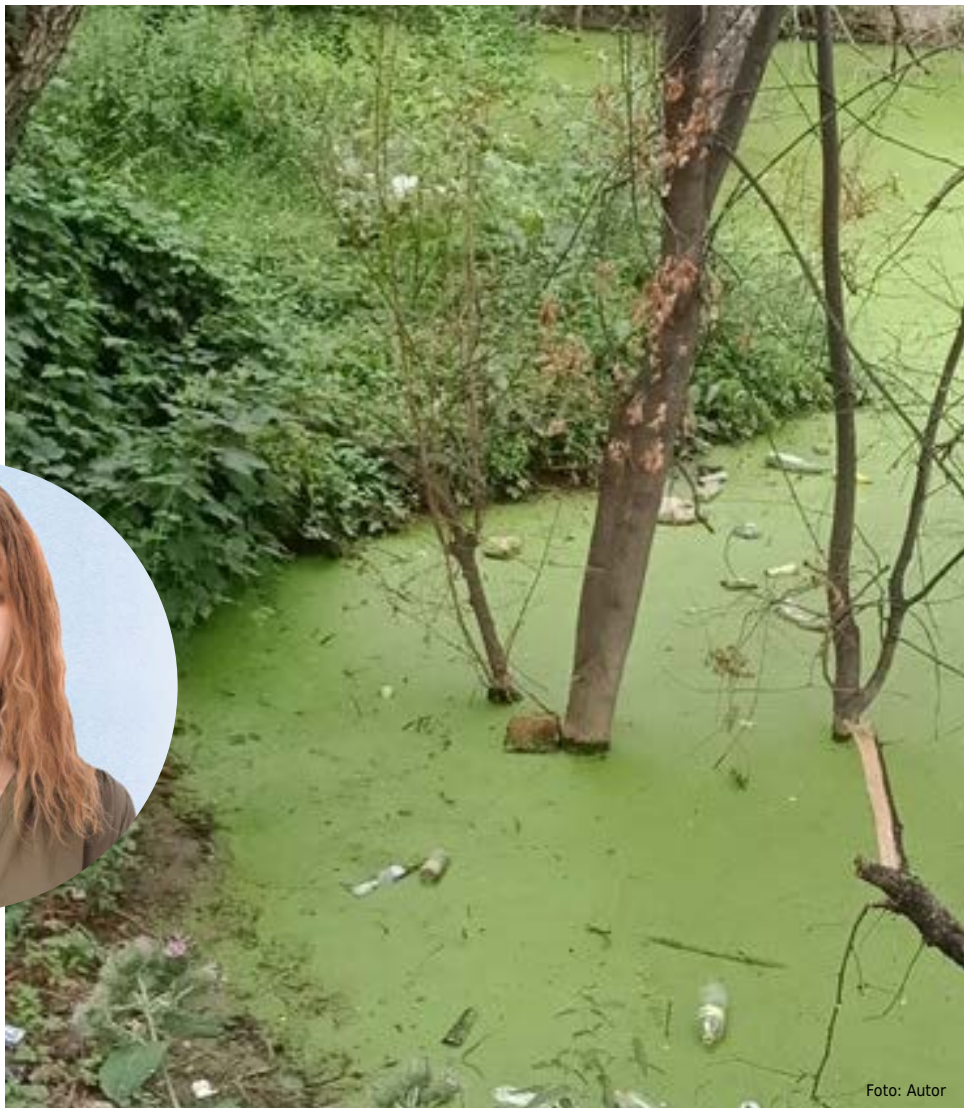
Die weit verbreitete Nachlässigkeit gegenüber der Natur zeigt sich nicht nur in Gesprächen, sondern auch in Handlungen: Der wunderbare Sumpfkomples in Ainabulak, in dessen Nähe ich zwei meiner Befragten getroffen habe, enthält bald mehr Müll als Wasser.

Ende vergangenen Jahres habe ich eine Umfrage zu dem Thema durchgeführt. Zielgruppe: Menschen im Alter von über 30 Jahren, darunter Bekannte und Fremde. Die Anzahl der Befragten betrug 30 Personen. Das Ergebnis war schockierend: 22 Menschen erklärten, dass sie Umweltproblemen absolut keine Bedeutung beimessen. „Ich glaube nicht an Ökologie“, teilte mir ein Mann vom Spielplatz mit. „Hätte die Erde so viele Milliarden Jahre existiert, wenn wirklich alles so zerbrechlich wäre?“ Ablehnung auch von Seiten einer Verwandten: „Nun, von hier aus kann keine Chemikalie in den Himmel fliegen und ein Loch in die Ozonschicht bohren. Das ist einfach lächerlich“, so ihre Meinung.