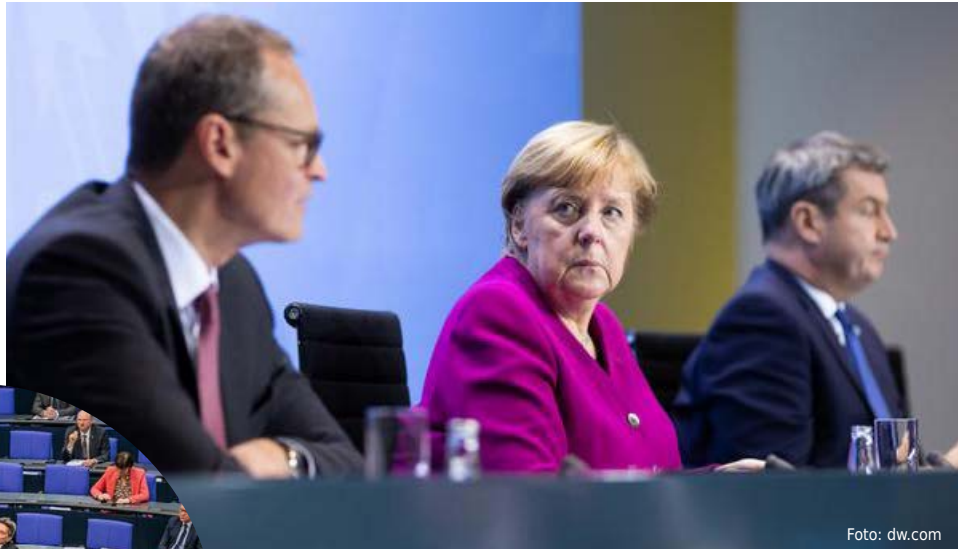
Einsame Entscheidungen in Hinterzimmern ohne Parlamentsbeteiligung: Merkel und die Ministerpräsidenten in der Corona-Krise

Ebenso scharfe Kritik kam von den Oppositionsparteien. Der Vorsitzende der FDP und ihr Fraktionschef, Christian Lindner, sagte: „Es kann nicht sein, dass das Parlament nur über den wöchentlichen Podcast von Frau Merkel und Pressekonferenzen über die Corona-Maßnahmen informiert wird. Der Bundestag wird nicht