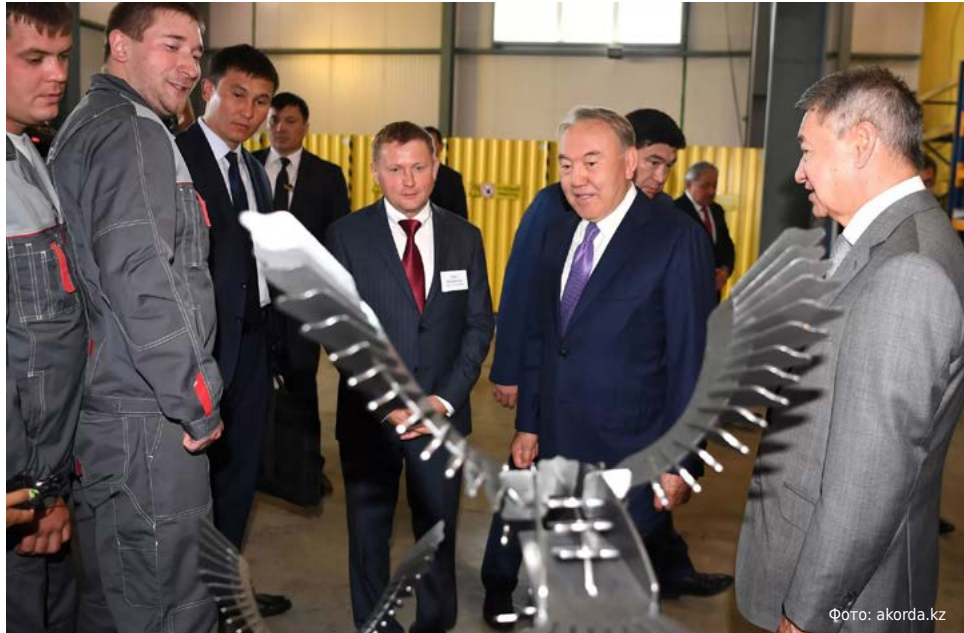
Рабочий визит Елбасы в Восточно-Казахстанскую область. Июнь 2018 г.

Евгений Шумахер сделал экскурс в историю, отмечая роль Елбасы в становлении независимости страны. В суровые 90-е годы Лидером Нации были приняты непростые, но судьбоносные решения. Нурсултан Назарбаев стал первым Президентом, который отказался от четвертого в мире ядерного потенциала и в 1991 году закрыл Семипалатинский ядерный полигон, показав всему миру беспрецедентный пример гуманизма и ответственного подхода к глобальной безопасности. 15 ноября 1993 года благодаря его личному участию в сложнейших экономических условиях Казахстана ввел в обращение собственную национальную валюту — тенге. Это дало импульс развитию рыночных отношений.