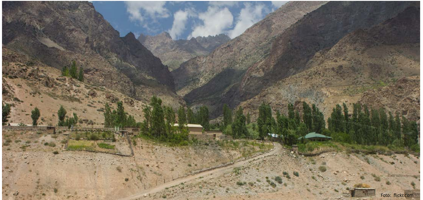
Landschaftsaufnahme von Tadschikistan. In dem Land ermordeten IS-Anhänger vier Fahrradtouristen.

Zum Zeitpunkt der Festnahme hatte die Zelle bereits scharfe Schusswaffen mit Munition besorgt. Sie besaßen Bauanlei-