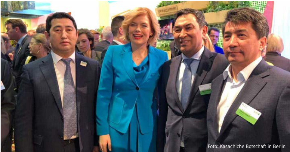
Julia Klöckner mit Vertretern der kasachischen Delegation

Kasachstan ist aber nicht das einzige Land, das auf der Grünen Woche Präsenz zeigte. Nachbar Usbekistan etwa präsentiert Produkte einer hochmodernen Schokoladenfabrik, die im Geschmack mit den westlichen Klassikern mithalten können. Die 2017 gegründete Gesellschaft Crafers verfügt über Produktionsstätten mit 20 Hektar Betriebsfläche, die mit einer jährlichen Kapazität von 46.000 Tonnen schon in der ersten Ausbaustufe mehr als 256 Arten Süßigkeiten produzieren soll. (cstr)