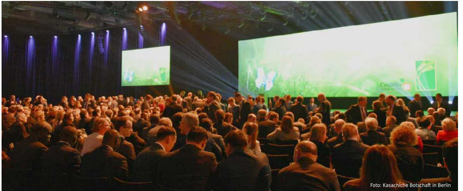
Eröffnungsveranstaltung zur Grünen Woche

An der Eröffnung nahm außerdem eine 13-köpfige Delegation aus Kasachstan teil, die vom ersten stellvertretenden Landwirtschaftsminister Ajdarbek Saparow angeführt wurde. Neben Vertretern des Landwirtschaftsministeriums gehörten der Gruppe auch Regierungsvertreter der Oblaste Akmolinsk, Nordkasachstan und Karaganda an. Die Mitglieder der kasachischen Delegation trafen sich mit den Landwirtschaftsministern Estlands und der Mongolei sowie unter anderem mit dem Parlamentarischen Staatssekretär im deutschen Landwirtschaftsministerium Uwe Feiler und Vertretern deutscher