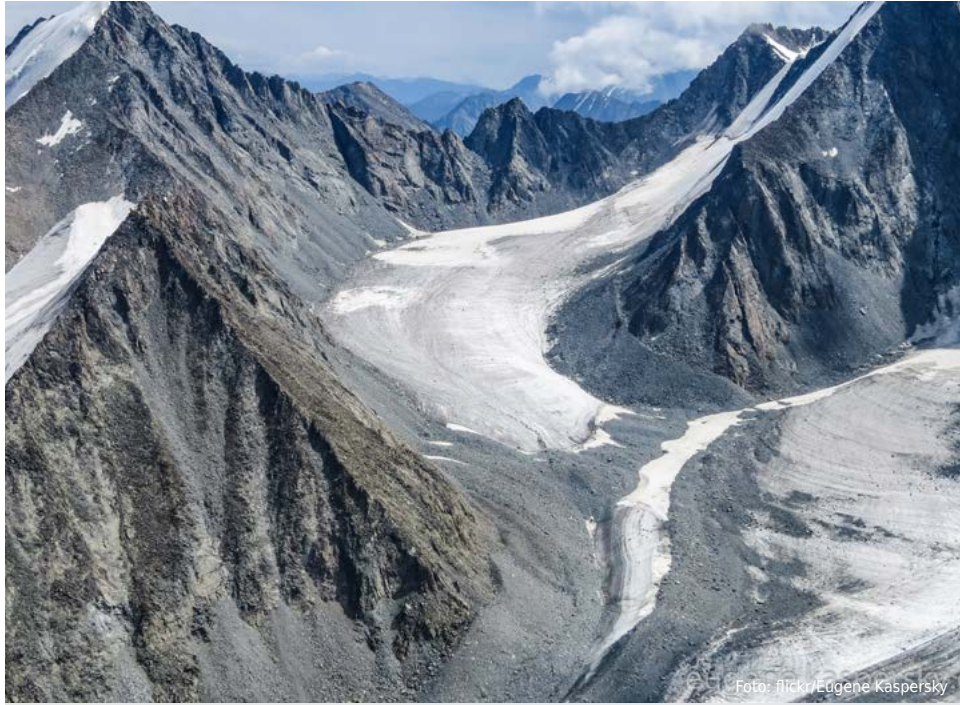
Das Altai-Gebirge ist das Produkt von Plattenbewegungen, die auch für Erdbeben sorgen.

Der Himalaya mit dem berühmten Mount Everest ist das höchste Gebirge der Welt. So kann man sich in etwa vorstellen, mit welcher Kraft sich die Indische Platte gegen die Eurasische Platte schiebt. Die Indische Kontinentalplatte besitzt einen nordwestlichen Ausläufer, der bei Tadschikistan mit der Eurasischen Kontinentalplatte kollidiert. Die Erdplatten stoßen mit großer Kraft beinahe frontal zusammen, sodass das Gestein nur in die Höhe ausweichen kann. So entstanden die mächtigen Berge des Altai-Gebirges. Der Altai erstreckt sich über rund 2.100 km Länge vom Quellgebiet der Flüsse Irtysh und Ob in Südsibirien bis in die Trockenregionen Xinjiangs und zum ostmongolischen Hochplateau.