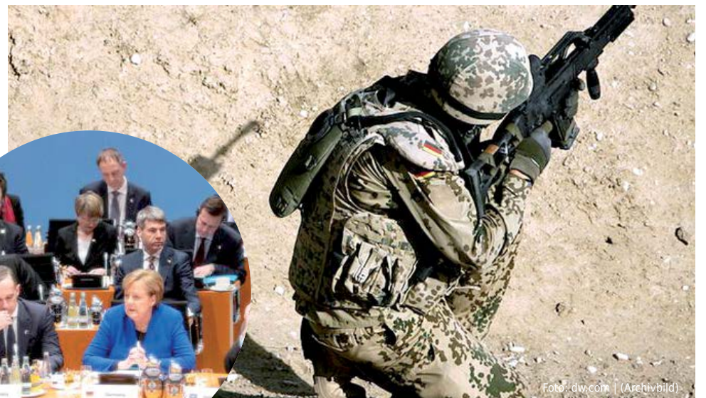
Bundeswehrsoldat im Auslandseinsatz in Afghanistan

Für die Rechtsaußen-Partei im Bundestag ist eine mögliche Beteiligung der Bundeswehr kein Thema. Die AfD erklärte die Berliner Konferenz per se für gescheitert: „Die Ergebnisse von Berlin sind reine Kosmetik, helfen den Libyern und den Flüchtlingen nicht und lassen den Krieg in