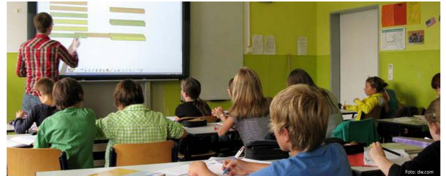
Lehrer vor Schulklasse. Gymnasiallehrer an Grundschulen

Diejenigen, die keine Beamtenstelle bekommen, haben verschiedene Optionen: Sie können es in einem anderen Bundesland versuchen, mit mäßigen Aussichten, denn nur in Hamburg und Sachsen-Anhalt fehlen ein paar Gymnasiallehrer – aber auch nicht unbedingt für Deutsch und Englisch. Sie können auch Kollegen vertreten, die zum Beispiel krank oder in Elternzeit sind. Dann erhalten sie einen Arbeitsvertrag, der vom ersten bis zum letzten Tag des Schuljahrs reicht. Im Sommer sind