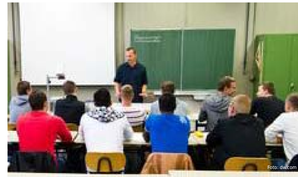
Viele der 4500 überzähligen Gymnasiallehrer finden eine Stelle an einer Berufsschule.

Am größten ist der Überhang – gemessen an der Bevölkerungszahl – in Baden-Württemberg: Auf 1.000 Stellen an Gymnasien und Gemeinschaftsschulen bewerben sich sich 3.131 ausgebildete Lehrer, wie der Landesverband der Lehrgewerkschaft GEW (GEW-BW) im Sommer mitteilte. Dabei sind die Chancen sehr unterschiedlich verteilt: Als Naturwissenschaftler hat man nämlich exzellente Aussichten, an einem baden-württembergischen Gymnasium verbeamtet zu werden. An den Gemeinschaftsschulen, schreibt die GEW-BW, hätten rund 40 Prozent der Stellen nicht besetzt werden können, weil es vor allem für Mathematik und in den MINT-Fächern (Mathematik, Informatik, Naturwissenschaft und Technik) nicht genug Bewerbungen gegeben habe. Für Sprachenlehrer dagegen tendieren die Chancen gegen null. Allein 1.000 Deutschlehrer haben sich diesen Sommer an Gymnasien in Baden-Württemberg beworben.