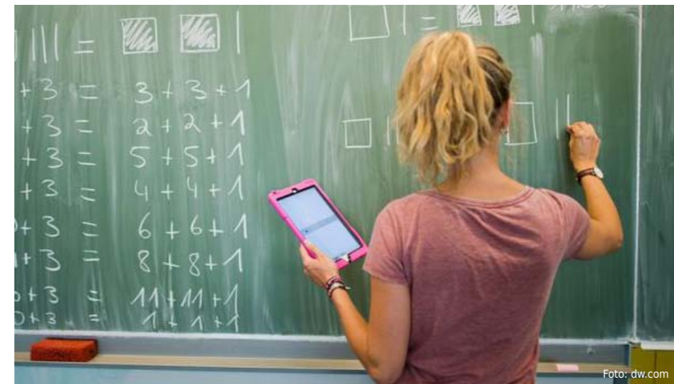
An deutschen Grund- und Primarschulen fehlen laut Lehrgewerkschaft in diesem Schuljahr 3220 Lehrkräfte.

Diejenigen, die keine Beamtenstelle bekommen, haben verschiedene Optionen: Sie können es in einem anderen Bundesland versuchen, mit mäßigen Aussichten, denn nur in Hamburg und Sachsen-Anhalt fehlen ein paar Gymnasiallehrer – aber auch nicht unbedingt für Deutsch und Englisch. Sie können auch Kollegen vertreten, die zum Beispiel krank oder in Elternzeit sind. Dann erhalten sie einen Arbeitsvertrag, der vom ersten bis zum letzten Tag des Schuljahrs reicht. Im Sommer sind