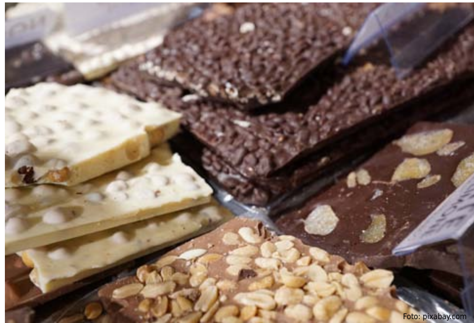
Die kostbare Kamelmilch wird zu verschiedensten Kamelmilchschokoladen verarbeitet.

Die Milch beinhaltet fünf Mal mehr Vitamin C und 30 Mal mehr Omega-3- und Omega-6-Fettsäuren als Kuhmilch. Sie ist frei von Allergien auslösenden Proteinen und somit für Personen mit einer Laktosein-