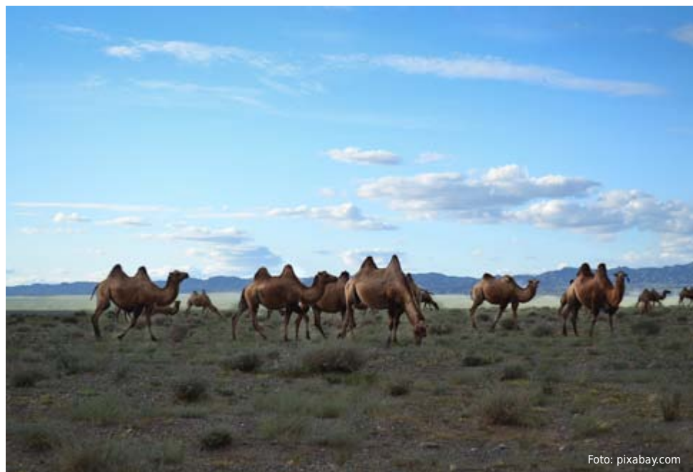
Zweihöckrige Trampeltiere beim Weiden in der Steppe.