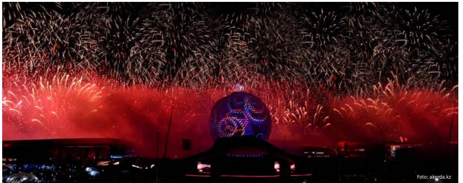
Mit einem großen Abschlussfeuerwerk ging die EXPO am Sonntag zu Ende.

„4“ ist die magische Ziffer, die am Ende der EXPO stand. Vier Millionen Besucher haben in den vergangenen drei Monaten die Weltausstellung in Astana besucht. Mit der Abschlusszeremonie ging eine der größten Veranstaltungen des unabhängigen Kasachstans zu Ende. Tausende Gäste tanzten, sangen und feierten bei teils strömendem Regen am Sonntagabend, bestaunten Lasershows und ein bombastisches Abschlussfeuerwerk.