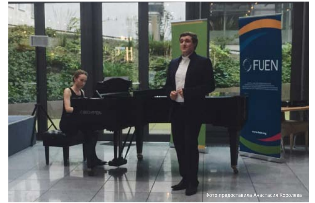
Культурная программа мероприятия.