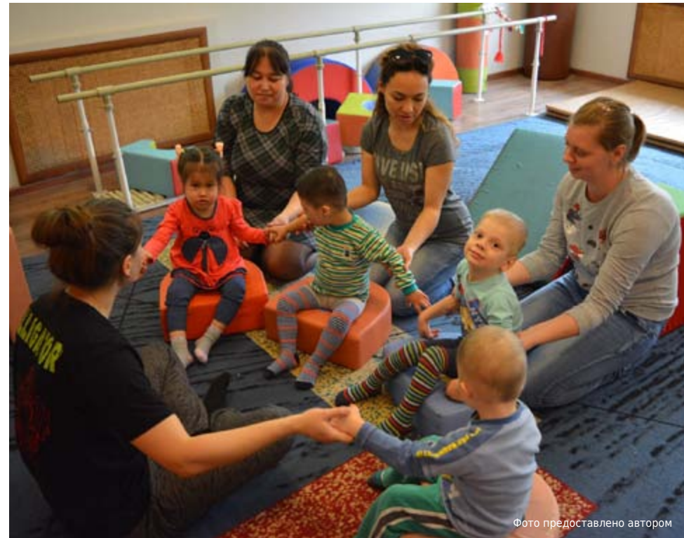
На одном из занятий в Центре.

С 1 апреля 2017 года Центр комплексной реабилитации «Кенес» в рамках государственного гранта некоммерческого акционерного общества «Центр поддержки гражданских инициатив» при поддержке Министерства по делам религий и гражданского общества РК реализует проект «Дети с ограниченными возможностями».