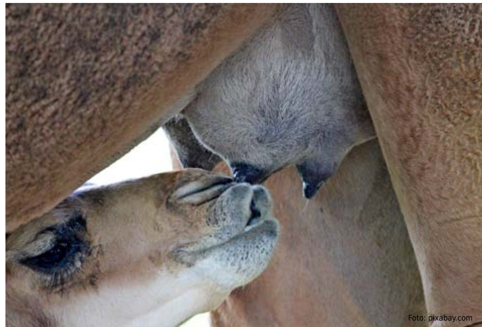
Ein junges beim Trinken der wertvollen Muttermilch.

Die gesundheitsfördernde Wirkung von Kamelmilch ist seit Jahrhunderten unumstritten. Insbesondere ihre Fähigkeit, das Immunsystem zu stärken, wird in den Vordergrund gestellt. Immer mehr wissenschaftliche Studien haben die wohltuende Wirkung des vielfach als weißes Gold bekannten Naturprodukts in den vergangenen Jahren bestätigt. So gilt es der Welternährungsorganisation FAO zufolge als wissenschaftlich bewiesen, dass Kamelmilch für an Diabetes, Autismus oder Lebensmittelallergien leidende Menschen eine gesundheitsfördernde Wirkung hat. Allen voran ist sie auch für ihre antibakterielle, antivirale und Anti-Tumor-Wirkung bekannt. Auch im Zusammenhang mit Erkrankungen des Magen-Darm-Trakts und der Leber findet Kamelmilch Anwendung.