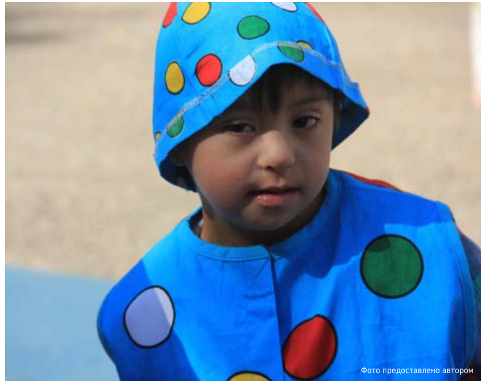
Отличительной чертой особых деток является их способность к творчеству.

Если патология выявлена сразу, то врачи берут на себя ответственность советовать мамам отказаться от этого малыша, а потом можно родить другого,