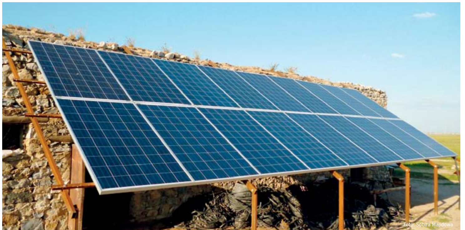
Private Solaranlagen in einer entlegenen Region um Samarkand.

Die neuen Energieformen und -techniken sind keine Chance, sondern ein Muss für die zentralasiatischen Länder. Der Ausbau der erneuerbaren Energien ist in Usbekistan, dem bevölkerungsreichsten Land Zentralasiens, schon 2013 rechtlich geregelt worden. Damit beabsichtigt man, dem Energiemangel und Konflikten mit Nachbarländern entgegenzuwirken. Die Forscher des Internationalen Sonnenenergie-Instituts in Taschkent und Spezialisten der Direktion für Erneuerbare Energien versprechen dem sonnenreichen Usbekistan bei der Erzeugung der Solarenergie Erfolg. Das Land steht dabei aber wegen der hohen Preise der Solaranlagen und der mangelnden Fachkräfte unter großem Leistungsdruck.