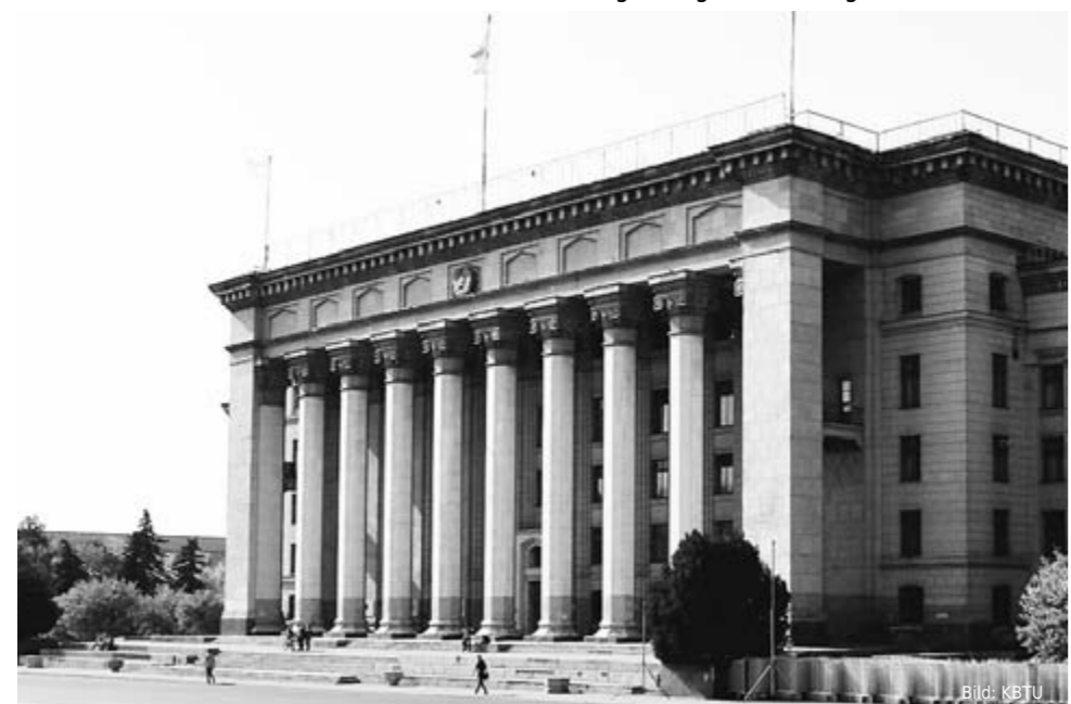
Kritischer Umgang mit Technologien: An der Kaschisch-Britischen Technischen Universität will man technische Studieninhalte mit geisteswissenschaftlichen verknüpfen.