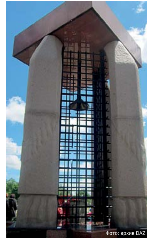
Памятник жертвам репрессий в поселке Жаналык Алматинской области.

В нашей стране осуществляются меры поддержки народов, репрессированных и насильственно депортированных в Республику Казахстан. Данная инициатива высоко оценена мировым сообществом, и многие государства участвуют в программах, связанных с поддержкой