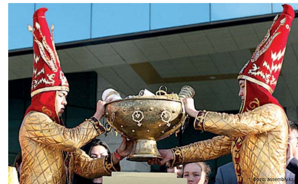
Тайказан – символ единства и благополучия народа.

• Апрель 2011 г. – XVII сессия «Независимый Казахстан: 20 лет мира, согласия и созидания». Указом Президента утвер-