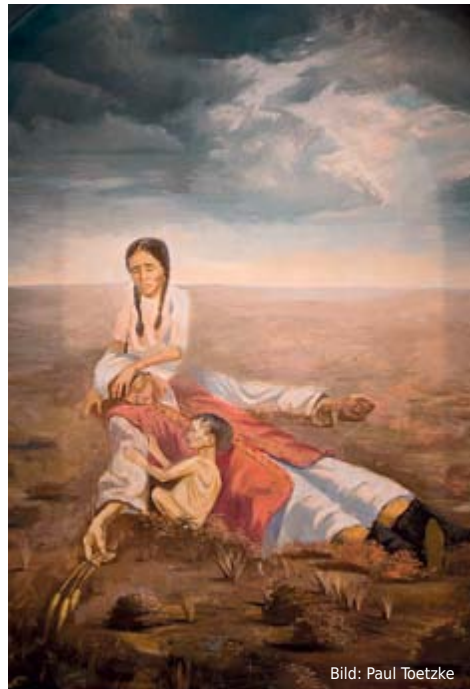
Wegen Stalins Kollektivierungsmaßnahmen starben zwei Millionen Kasachstaner durch Hungersnot.

Im Erdgeschoss wird man von rotem Licht und schauriger Hintergrundmusik verfolgt. In verschiedenen Themenräumen wird der Besucher über die Anfänge der Sowjetunion in Kasachstan informiert. Kollektivierung, der Holodomor – die große Hungersnot Anfang der 30er, die nicht nur die Ukraine, sondern auch Kasachstan betraf – und die Deportationen verschiedenster Nationalitäten unter Stalin. Deutsche, Koreaner, Polen und viele mehr – sie alle wurden zu Staatsfeinden deklariert.