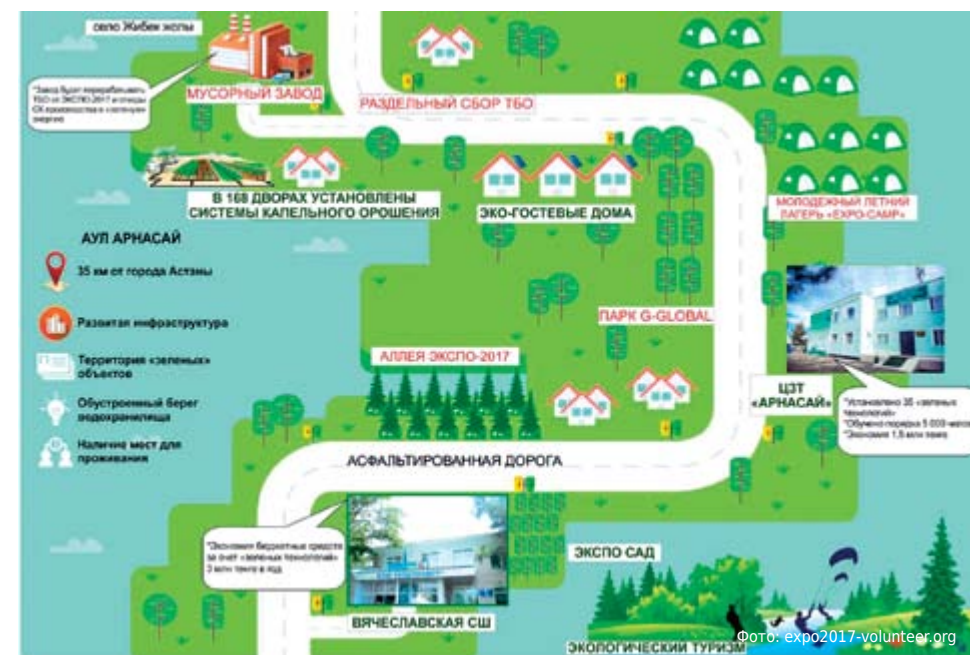
Арнасай – первое «зеленое» село Казахстана (объект посещения гостями ЭКСПО-2017, сроки: июнь-сентябрь 2017 года).

Как отметила спикер, в местной малокомплектной школе поставлены солнечные батареи и коллекторы, пиролизные печи, светодиодное освещение, фильтры для очистки воды. «Школа сэкономила три миллиона бюджетных средств в