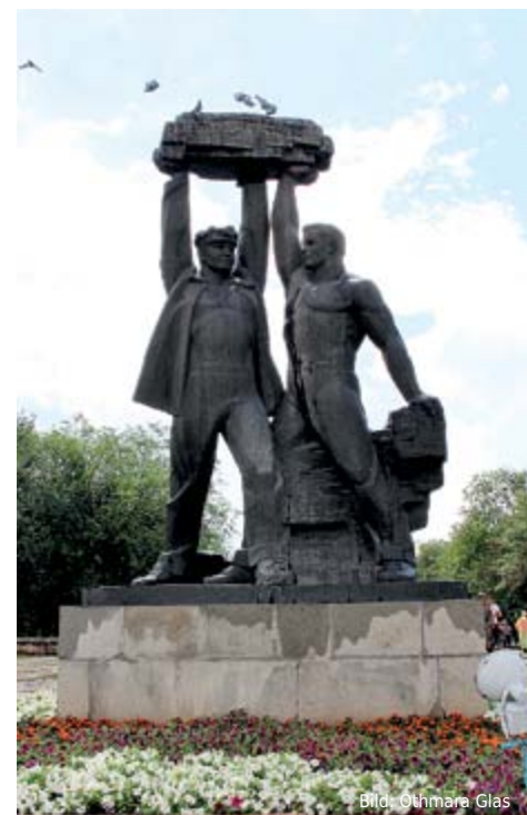
Denkmal für die Bergarbeiter. Noch heute ist der Kohleabbau ein wichtiger Industriezweig und Arbeitgeber in der Region.

zu einem Ziel, das Kasachstan von einer anderen Seite als die Metropolen Almaty und Astana zeigt. ■