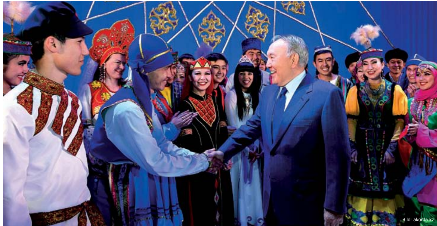
Nursultan Nasarbajew besucht im südkasachischen Schymkent das Haus der Volksversammlung.

• Oktober 2008 – XIV. Sitzung; Motto: „Die Stärke des Landes liegt in der Einheit des Volkes!“ Annahme des Gesetzentwurfes „Über die Volksversammlung Kasachstans“, welcher die normative Regelung der Tätigkeit und Struktur derselben auf Geset-