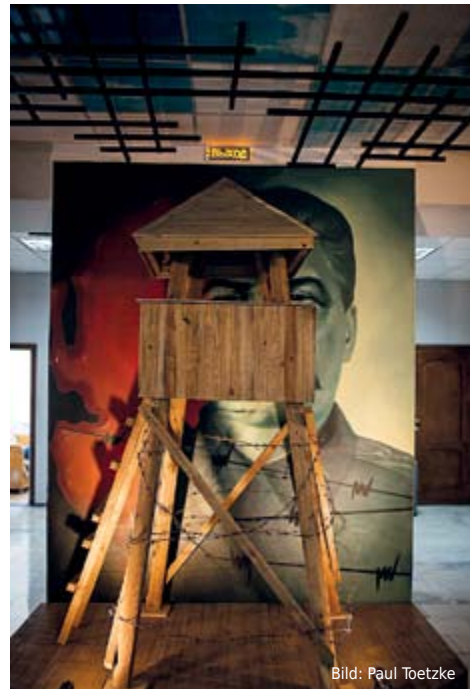
Diese Installation symbolisiert die staatliche Überwachung. Stalin hat einen immer im Blick.

Bereits im Eingangsbereich wird klar, dass hier nichts beschönigt werden soll. Ein zerbrochenes Jurtendach symbolisiert den Widerstand der lokalen Bevölkerung gegen den Terror, darüber eine weiße Taube für die Freiheit. Gleich dahinter kann man Stalin direkt in die Augen schauen. Davor steht ein von Stacheldrahtzaun umgebener Wachturm. „Egal wo sie stehen, Stalin guckt sie aus jeder Perspektive an. Probieren Sie es aus“, sagt die Führerin. Man soll