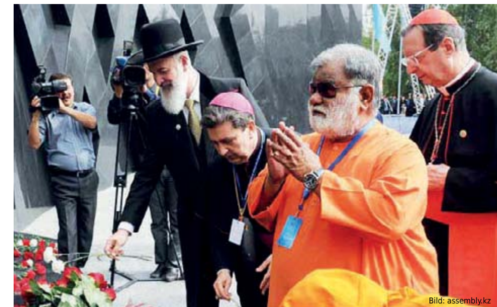
Religionsvertreter vor dem Denkmal zur Erinnerung an Opfer politischer Repressionen (Astana).

überprüft Gesetze auf ihre Übereinstimmung mit Artikel 39 der Verfassung, der ethnische Spannungen verhindern soll. ■