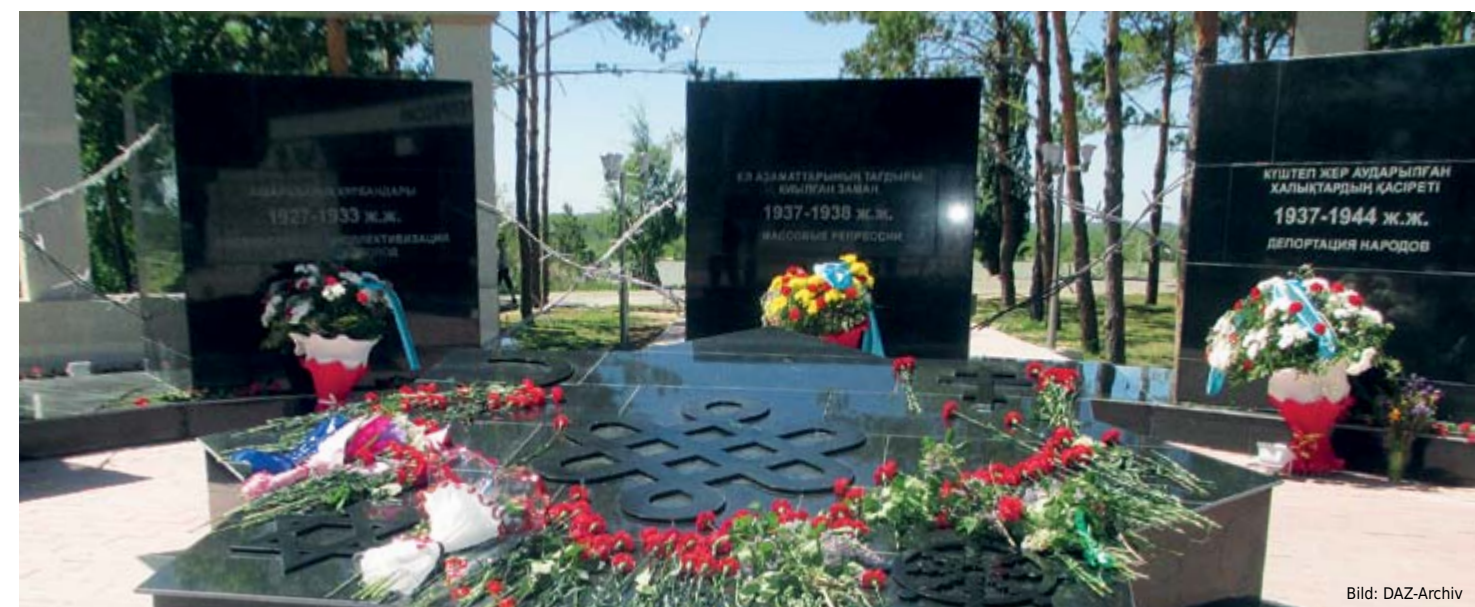
Denkmal zur Erinnerung der Opfer von Massenrepressionen in Pawlodar.

Das Staatsoberhaupt richtete die Aufmerksamkeit der Tagungsteilnehmer auf aktuelle globale Risiken, mit denen Staat