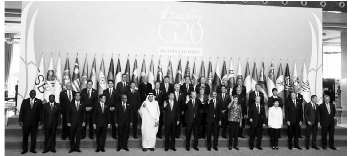
G-20-Gipfel in Antalya – Gruppenbild.

Viele westliche Geheimdienste haben in ihren Dossiers immer wieder darauf hingewiesen, dass Kuwait, Katar und Saudi-Arabien jahrelang die Terrorgruppe „Islamischer Staat“ finanziert haben. Diese sunnitisch