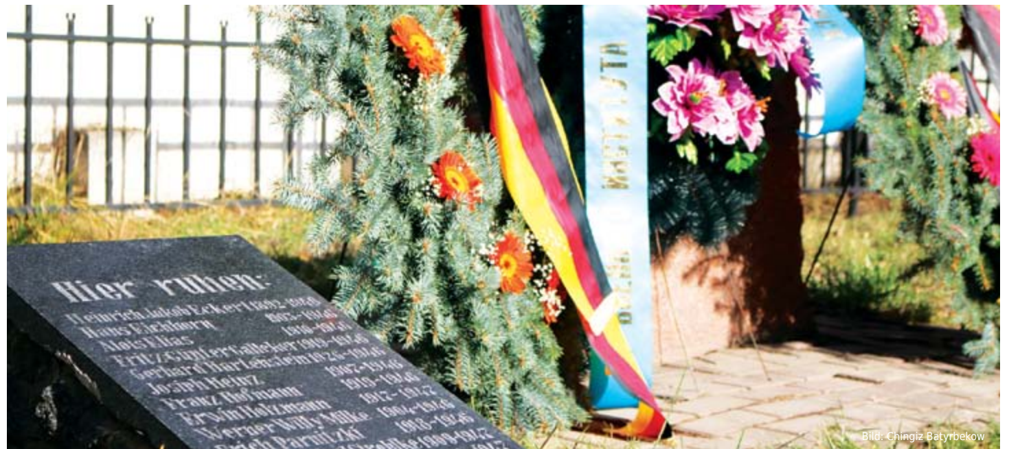
Kranzniederlegung anlässlich des Volkstrauertags auf dem Soldatenfriedhof in Almaty (15. November 2015)

Der 15. November ist ein Datum, was dieses Jahr unter anderem für den deutschen Volkstrauertag stand. Es stand aber auch für den Tag nach den terroristischen Anschlägen, die in der Nacht vom 13. auf den 14. November in Paris stattfanden, deren Geschehnisse erneut den gesamtgesellschaftlichen Frieden dieses europäischen Landes und den seiner Nachbarn herausfordern.