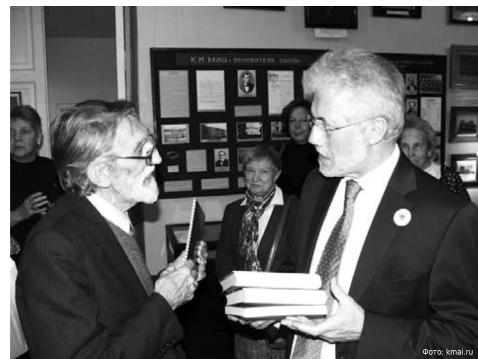
Визит Генерального консула ФРГ г-на Петра Шаллера в Музей истории школы К.Мая.