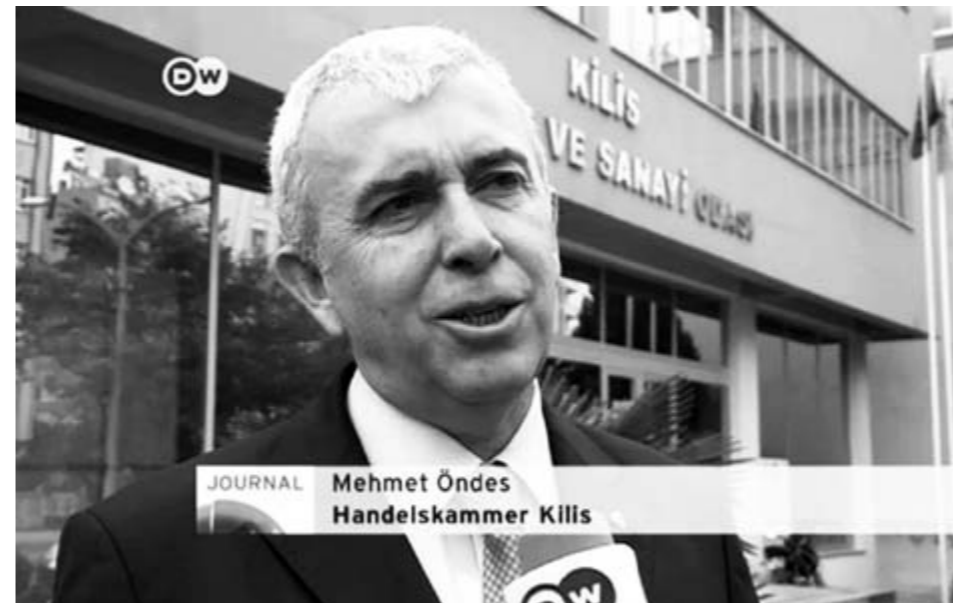
Türkei: Wie sich der IS versorgt (28.11.2014)

Finanzierung und Nachschub für die Terroristen des „Islamischen Staates“ liefen zumindest bis vor einigen Wochen relativ ungestört, glauben Fachleute und auch viele westliche Geheimdienste. Einnahmequellen sollen weiterhin der Verkauf von Öl aus Syrien und dem Irak sein. Dazu kommen erpresste Lösegelder für westliche Geiseln und Erlöse aus dem Verkauf von Antiquitäten und Altertüchern.