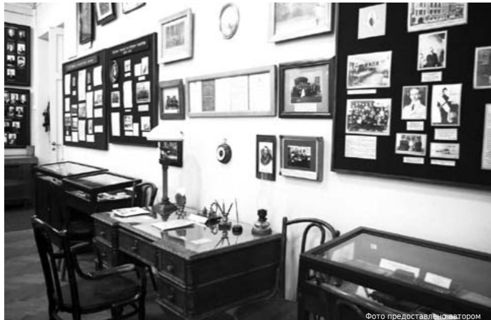
Главный зал музея.

Карл Иванович Май был педагогом, организатором и первым директором прославленной школы. Родился он 29 октября (10 ноября по новому стилю) 1820 г. в Санкт-Петербурге. Его отец был выходцем из Пруссии, родители матери – шведы. В 1845 г. он окончил историко-филологический факультет Санкт-Петербургского университета. В 1856 г. группа предпринимателей немецкого происхождения предложила ему основать частную школу для мальчиков, которая была открыта 10 сентября 1856 г.