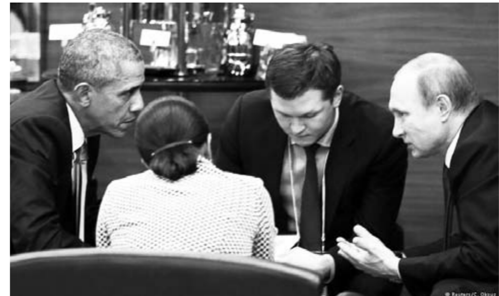
Spontane Verhandlungen zu Syrien: Präsident Obama (li.), Präsident Putin (re.)

den, dass sich jetzt gegen sie selbst richtet“, schrieb Wagner in der „Huffington Post“. Einzelne reiche Individuen aus den genannten Staaten würden den „IS“ aber weiter finanzieren helfen. Dem könnte Saudi-Arabien