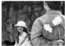
шақыру / пригласить / einladen