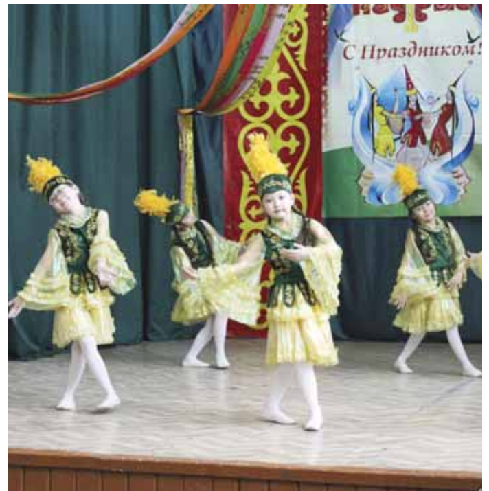
In der Ostrowski-Schule für Sehbehinderte und Blinde im Wohngebiet Orbita, Almaty, lernen 227 Schülerinnen und Schüler mit eingeschränkter Sehfähigkeit und 65 blinde Schüler und Schülerinnen. Trotz ihrer körperlichen Einschränkung strahlen sie vor Lebensfreude. In der Schule gibt es verschiedene Nachmittagskurse, in denen sie tanzen, singen oder musizieren. (DV)