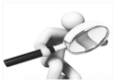
іздеу / искать / suchen