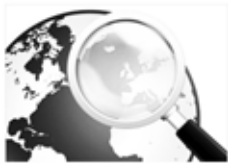
табу / найти / (auf)finden