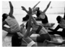
орындау / выполнять / erfüllen