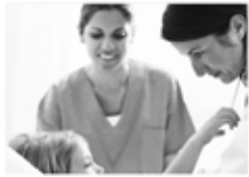
қатысу / участвовать / teilnehmen