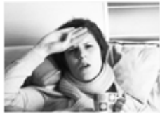
ауырып қалу / заболеть / erkranken