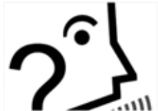
сұрау / спросить / fragen