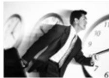
асығу / спешить / eilen