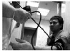
тексеру / проверять / prüfen