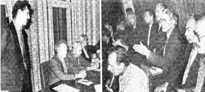
Deutsche Allgemeine Zeitung, Oktober, 1992.