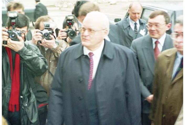
Визит Федерального Президента Германии Р.Херцога в 1995 году.