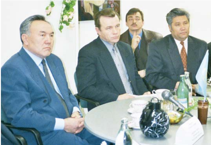
Президент Республики Казахстан Н.А.Назарбаев в немецком доме Алматы, 1994 г.