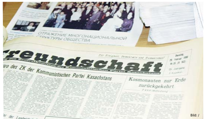
Seit 1966 gibt es eine deutsche Zeitung in Kasachstan.

Nach wie vor ist die „Deutsche Allgemeine Zeitung“ (DAZ) heute den Interessen der deutschen Minderheit in Kasachstan verpflichtet. Als einzige deutschsprachige Zeitung in der Region Zentralasiens, berichtet sie über gesellschaftliche und kulturelle Veranstaltungen, die von der Assoziation gesellschaftlicher Vereinigungen der Deutschen Kasachstans „Wiedergeburt“, der