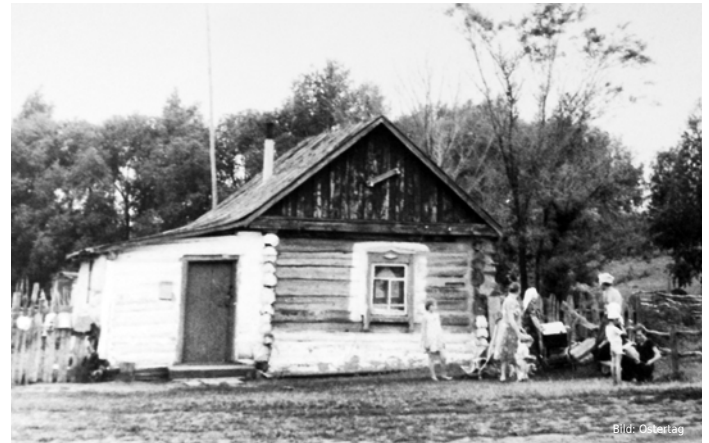
Das Haus der Familie Tjunkin befindet sich im Dorf Gernischowka.