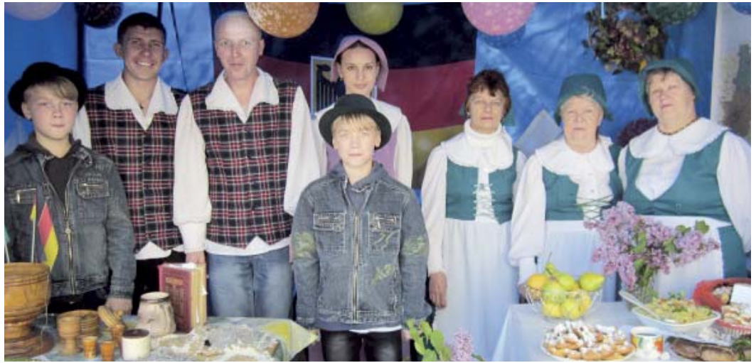
С поздравлениями коллектив и члены общественного объединения «Балхашское городское общество «Немецкий центр «Возрождение».

Поздравляем всех с замечательными юбилеями! Желаем коллективу Немецкого дома и его руководству дальнейших успехов.