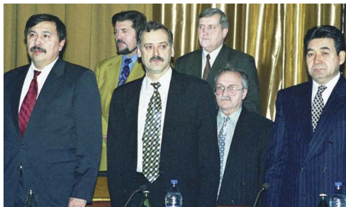
Казахстанско-германская межправительственная комиссия.

Но вернемся к теме открытия Немецкого дома. На съезде немцев Казахстана, проходившем в Алматы в 1992 году, присутствовала делегация Федерального правительства Германии, с которой у нас состоялись первые переговоры. Одним из вопросов, интересующих немецкую сторону, была концепция развития немецкого движения в Казахстане. Мы пояснили, что изначально необходимо создать центр для структуризации всей работы поддержки немецкого меньшинства. После у нас завязались тесные контакты. Меня неоднократно приглашали в Германию, где проходили встречи с Хорстом Ваффеншмидтом, уполномоченным Федерального правительства Германии по делам переселенцев и национальных меньшинств. Неоднократно мы совершали эти визиты с Генрихом Гроутом, который предлагал свое видение решения немецкого вопроса, в основном связанное с восстановлением Республики немцев в Поволжье. Для нас, казахстанцев, такая проблема не являлась жизненно важной.