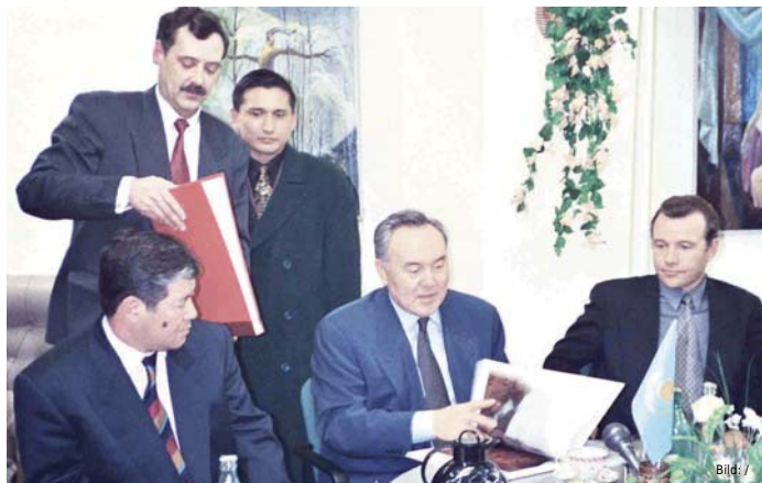
Визит Н.А.Назарбаева в Немецкий дом.

В 1993 году Гизела Бивер вновь приехала в Казахстан, сообщив, что правительство Германии намерено купить здание и открыть центр. Начались усиленные поиски. В Алматы в то время