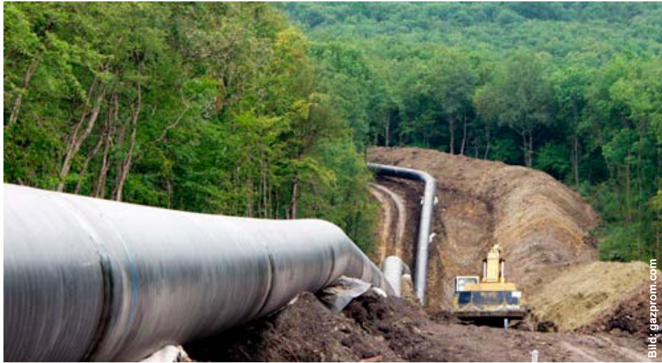
Lange Leitung: Fünf bis sechs Tage braucht das Gas aus Sibirien, bis es nach einer 5000-Kilometer langen Reise in deutschen Haushalten ankommt.