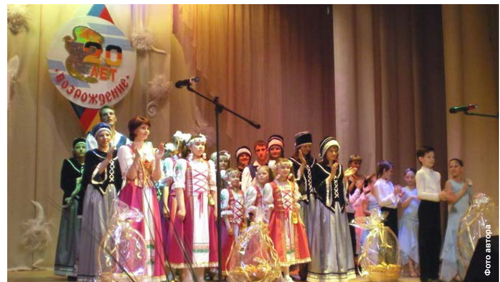
На юбилей пришли представители многих национальных диаспор

В праздничном концерте приняли участие все коллективы Центра, а также гости из города Березовского Кемеровской области. Отрадно было видеть, что с юбилеем Центр немецкой культуры пришли поздравить и представители других национальных диаспор: русские, казаки, армяне. (ORNIS)