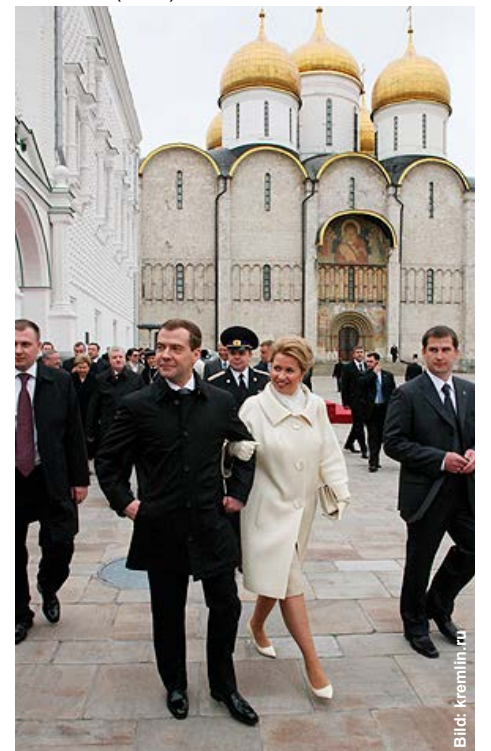
Das russische Präsidentenpaar nach der Amtseinführung im Kreml: „Der Mann ist der Kopf, die Frau der Hals“.

Als Präsidentengattin muss sich Swetlana Medwedewa nun also nicht groß umstellen. Sie kennt das Leben von Empfängen und internationalen Veranstaltungen. Und sie ist wohl auch stolz darauf, dass ihr Dmitri es so weit gebracht hat – mit ihrer Hilfe. (n-ost)