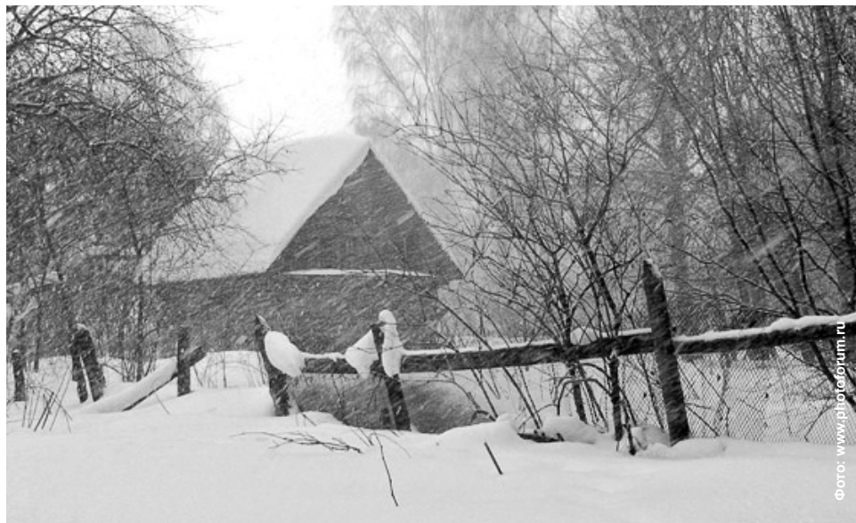
Зимы казались бесконечно длинными.

В одиночестве он «изобретал» из пенала заводской корпус. Карандаши превращались в дымящие трубы. Устав возиться по полу, он усаживался на подоконник и дыханием оттаивал себе смотровой глазок на улицу, в большой мир. Считал ехавшие мимо сани. А когда пурга