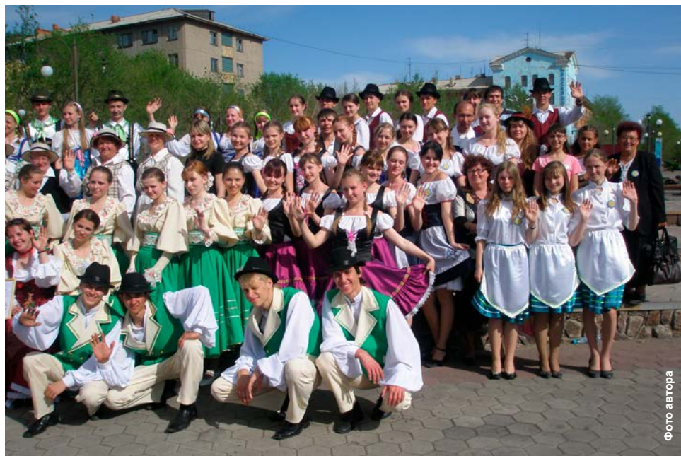
Парад-шествие участников фестиваля.

И вот дан сигнал о последней подготовке, парад начался. Шествие по площади детей, мо-