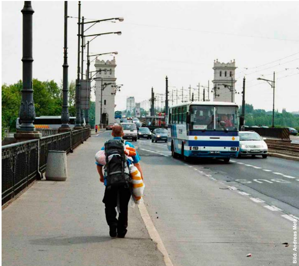
Mit dem Rucksack durch den „wilden Osten“ – Szene aus Warschau.