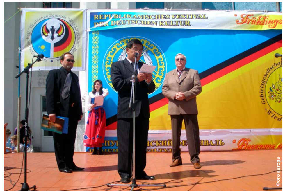
Открытие фестиваля в городе Сарани.

ЦНК Анжеро-Судженска на протяжении многих лет ведёт общественно-значимую работу, охватывая все возрастные группы населения. Деятельность ведётся по следующим направлениям: развитие культуры российских немцев, организация языковых курсов для взрослых, языковых кружков для детей и молодежи, этнокультурных кружков для взрослых и детей, организация летнего отдыха детей, санаторно-курортного лечения для трудармейцев из числа российских немцев, поддержка концертной деятельности творческих коллективов «Лорелей» и «Фольксштимме». Центр немецкой культуры сотрудничает с детскими садами, школами, предприятиями Анжеро-Судженска, имеет огромный опыт подготовки и проведения не только городских и региональных, но и межрегиональных мероприятий.