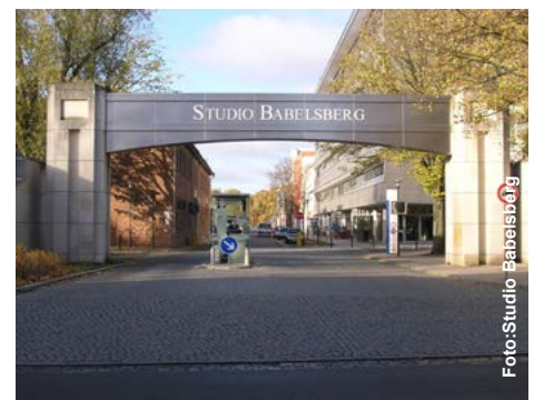
Seit 97 Jahren werden hier Filme gedreht: Potsdam-Babelsberg

Produktionsfirmen der wichtigste regionale TV- und Radiosender, RBB (Rundfunk Berlin-Brandenburg), sein Sendezentrum. Dazu kommen Institutionen wie das Deutsche Rundfunkarchiv oder die Hochschule für Film und Fernsehen, eine der besten Adressen im Land für die Ausbildung in den Fächern Drehbuch, Regie, Kamera oder Schauspiel. (Deutschland magazine)