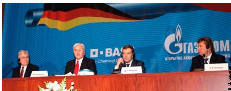
Seit Ende 2007 fördert mit der BASF erstmals ein deutsches Unternehmen Erdgas direkt in Westsibirien. Entsprechend hochrangig waren die Gäste bei der Inbetriebnahme: Bundesaußenminister Frank-Walter Steinmeier und der ehemalige Gasprom-Aufsichtsratschef Dmitri Medwedew.

Erdöl kann man notfalls in Eimer füllen und dann zu Märkten tragen. Das ist bei Erdgas nicht möglich. Natürlich ließe sich das System mit seinen zwölf Ferngasleitungen vom Fördergeschäft trennen, das ist zumindest denkbar. Aber nicht mal die Reformer der Jelzin-Jahre haben ernsthaft darüber nachgedacht. Das hätte der damalige Ministerpräsident Viktor Tschernomyrdin und frühere Gaspromchef sicherlich auch zu verhindern gewusst. Nur mit dem Leitungsmonopol konnte Tschernomyrdin Anfang der neunziger Jahre dieses monströse sowjetische Gasministerium in einen gewinnorientierten Konzern umwandeln.