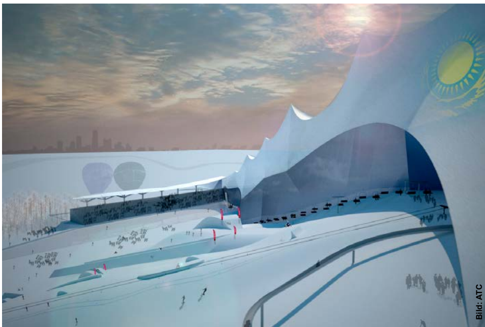
Mount Astana: Künstlicher Hügel mitten in der flachen Steppe.

Ein Argument haben die Planer von ATC schon jetzt auf ihrer Seite. Ihrer Meinung nach würde „Mount Astana“ den Grundstein legen für ein weiteres kasachisches Großprojekt: Bei der Bewerbung für die Olympischen Winterspiele im Jahr 2014 war Kasachstan gescheitert. Sie finden in Sotschi in Russland statt. Wenn der Berg tatsächlich errichtet werden sollte, halten die deutschen und österreichischen Planer Olympia in Kasachstan im Jahr 2022 für möglich.