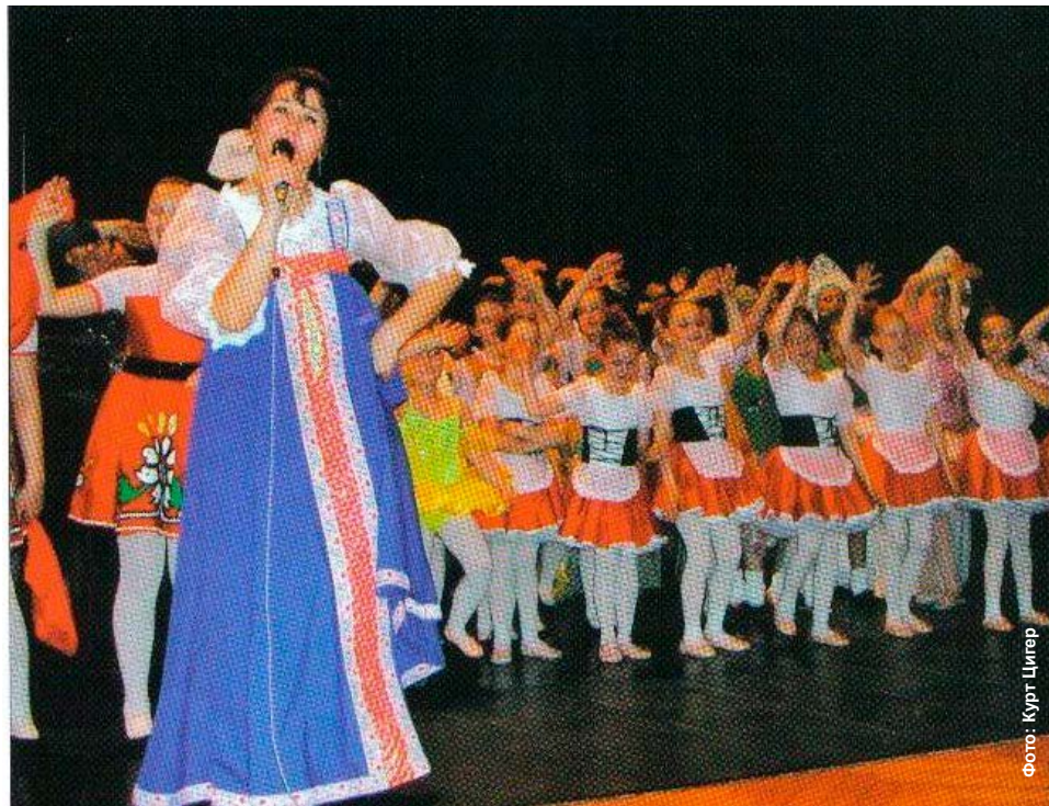
Танцовщицы привели в восторг своим мастерством и грациозностью.

Материал на русском языке подготовила к публикации Надежда Рунде