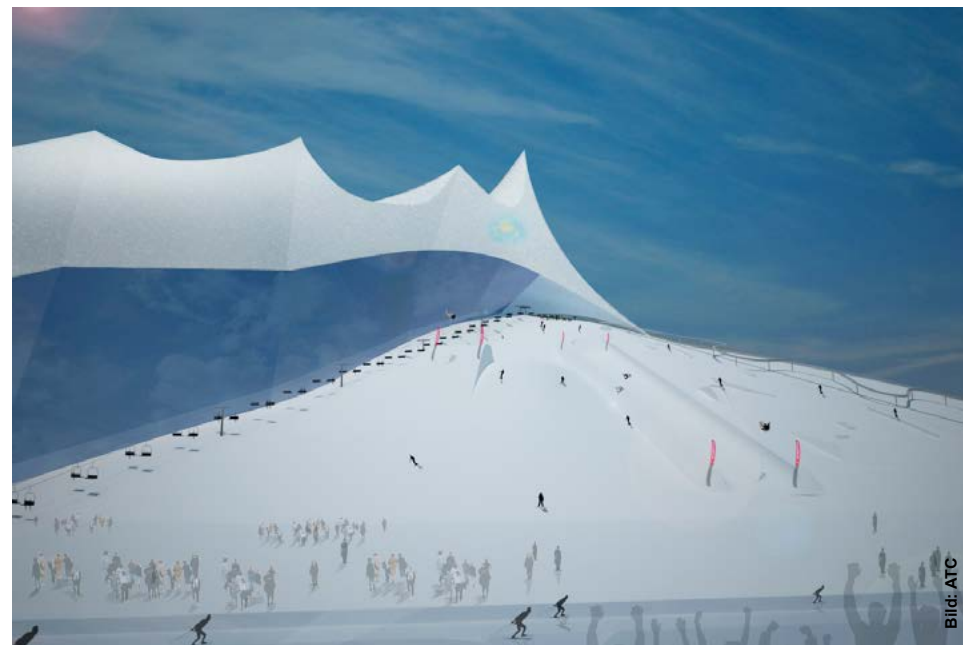
Direkt an die Skipiste soll sich eine unterirdische Langlaufloipe anschließen.

Das Loch, das beim Aufschütten des Erdreichs am „Mount Astana“ entsteht, möchte Heinrich gleich in die gesamte Anlage integrieren - als künstlichen See, in dem Schwimm- oder Kanuwettkämpfe stattfinden und an dem Freestyle-