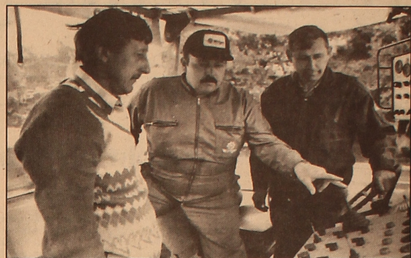
Наверняка жителям Семипалатинска будут завидовать автолюбители и южной, и северной столицы республики: здесь начата уникальная для Казахстана реконструкция дорог.