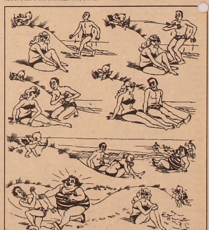
Рисунок Херлуфа Бидструпа

Но не соколы отправили в отставку голубей. Развитие радиосвязи было тому причиной. И хотя радио бурно, широким фронтом входило в нашу жизнь, человек все же не сразу смог расстаться с голубями. Еще во времена Великой Отечественной войны в наших войсках с помощью «голубевязи», как она называлась в официальных бумагах, было доставлено и получено около 15 тысяч донесений.