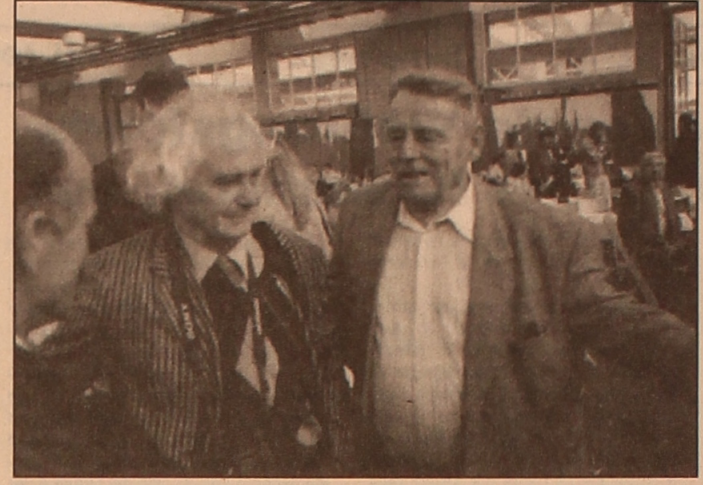
Der Dank der Import-Sieger an ihr neues Land: