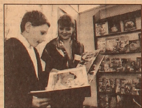
Im Ausstellungskomplex «Atakent» hat am 21. März die Internationale Buchmesse «Russkaja kniga» ihre Arbeit begon- nen. Ihre Organisatoren sind die Nationale Agentur für Presse und Massenmedien Kasachstans, die Hauptdirektion der Buchausstellungen des Pressekomitees der Russischen Föderation und die internationale Wochenschrift «Asija - ekonomika i shisn». Der akute Mangel an Neuerscheinungen auf dem kasach- stanischen Markt, in den letzten Jahren eine gewisse Erschaf- fung der schöpferischen und Kulturbeziehungen zwischen unseren Ländern schufen ein dringendes Bedürfnis an der Wiedergeburt und Weiterentwicklung des traditionellen Bücheraustausches. Die jetzige Buchmesse ist ein fälliger Schritt auf dem Wege zu solcher Zusammenarbeit. Unser Bild: Literatur für Kinder und Jugendliche.