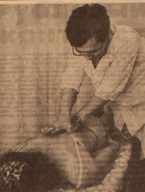
Praktische Ratschläge Für Handwerker Eine Nachtschlampe für das Kinderzimmer