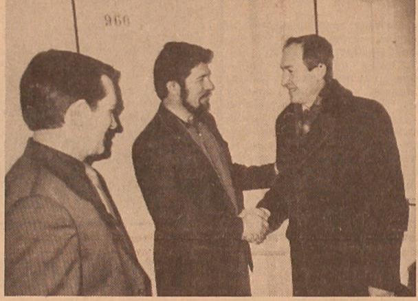
Это было... было