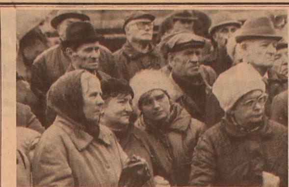
Митинг по случаю открытия памятника жертвам сталинизма.