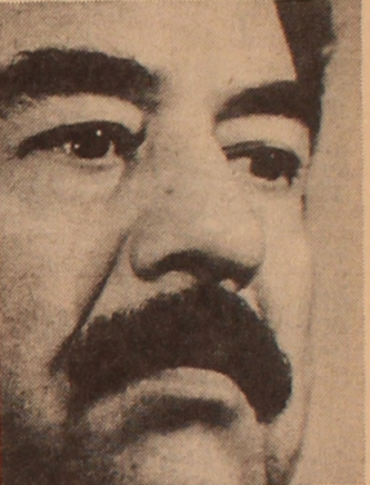
Die irakische Aggression gegen das benachbarte Kuweit hat buchstäblich die ganze Welt aufgerüttelt. Täglich bringt der TASS-Fernschreiber Mitteilungen über die Ereignisse in dieser Region und im Raum des Persischen Golfes: Die USA und ihre Verbündeten im Nordatlantikblock konzentrieren ihre Streitkräfte und Kriegsschiffe in den Gebieten des eventuellen Zusammenstoßes mit den Streitkräften Iraks. Aus Kuweit werden ausländische Bürger evakuiert, die Weltpreise für Erdöl steigen, in vielen Ländern finden Kundgebungen statt, die die Politik Iraks und die Gegenmaßnahmen der USA unterstützen oder sie im Gegenteil unterfüttern. Besorgnis erregen die Mitteilungen über die Lage von Geiseln im Irak und in Kuweit. Die Bemühungen der Weltöffentlichkeit in der Person der UNO, den Konflikt durch friedliche Mittel beizulegen, sind einstweilen nicht von Erfolg gekrönt. Unser Bild: Der Präsident Iraks Saddam Hussein.

Sollte der Westen diesmal der irakischen Kurdenbewegung helfen, so ist im Gegenzug verstärkte Unterstützung Saddams Hussein für die PKK in der Türkei zu erwarten. Und das, obwohl An-