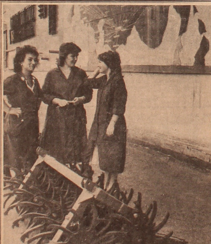
Das Problem der Produktionsqualität unter den Bedingungen des freien Marktes, wo die Betriebe um den Konsumenten kämpfen müssen, gewinnt die erste Bedeutung.

Оргкомитеты проводят широкую разъяснительную работу среди местного и, в первую очередь, немецкого населения целей и задач Съезда советских немцев, для чего организуют встречи своих представителей с группами населения в трудовых коллективах и по месту жительства, выступления на эту тему в местных газетах, на радио и телевидении, обсуждение проектов основных документов (Окончание на 2 стр.).