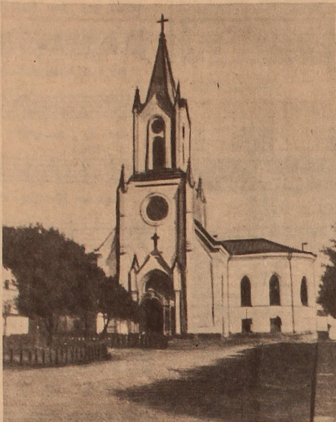
Лютеранская церковь св. Петра и Павла в Москве.

Чтобы выйти из такого бедственного положения, — пишет Конрад Келлер в своей книге о немецких колониях на юге России. — Ришелье написал министру торговли Румянцеву и попросил прислать мастеровых из Петербурга. 14 мая 1803 г. Румянцев ответил: «Ваш отчет, в котором Вы пишете о крайней нехватке мастеровых в Одессе, я представил императору и о согласии Его Величества. Отправлю в Одессу в ближайшие дни столя-