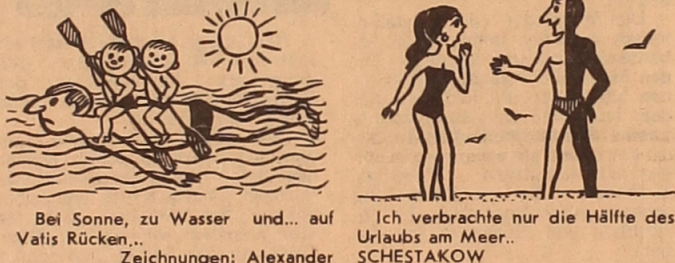
Bei Sonne, zu Wasser und... auf Vatis Rücken... Ich verbrachte nur die Hälfte des Urlaubs am Meer... Zeichnungen: Alexander SCHESTAKOV

Diese Frage kommt mir immer wieder in den Sinn, wenn ich an das tragische Schicksal ihrer Kinder denke... Edmund OBERMANN