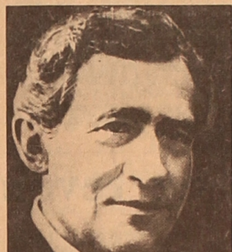
Nach Ausbruch des Ersten Weltkrieges galt Lonsinger als „unzuverlässig“...