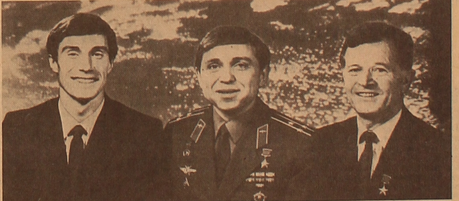
Bordingenieur Sergej Konstantinowitsch Krikaljow, Kommandant der Besatzung Fliegerkosmonaut der UdSSR, Held der Sowjetunion Alexander Alexandrowitsch Wolkow und der französische Forschungskosmonaut, Held der Sowjetunion, Jean-Loup Chretien.