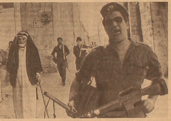
Die israelischen Behörden fahren fort, systematisch und grausam mit der palästinensischen Bevölkerung abzurechnen, die den Kampf gegen die widerrechtliche Okkupation ihrer Territorien angesagt haben...

Wladimir TSCHERNYSCHOW, TASS-Kommentator