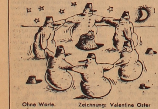
Ohne Worte. Zeichnung: Valentine Oster

'Ist denn das Hemd auch bügelfrei?' 'Ja', sagt die Verkäuferin, 'den Bügel habe ich bereits rausgenommen.'