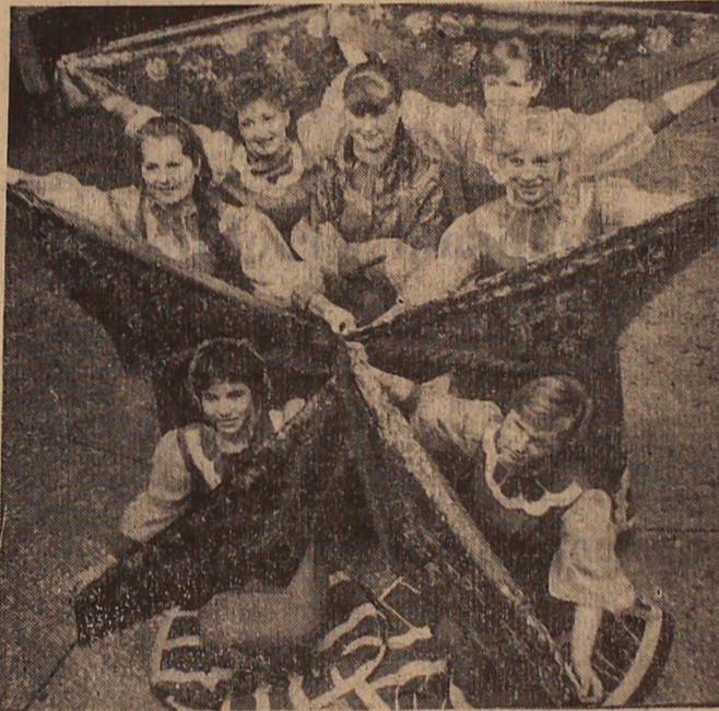
Im Dezember 1983 fand im Sowchos 'Noworybinski' Rayon Alexejewka, Gebiet Zelinograd, die feierliche Eröffnung eines Kultur- und Sportkomplexes statt...