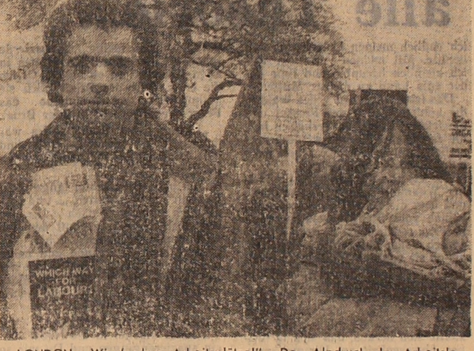
LONDON. „Wir fordern Arbeitsplätze“. „Den Alpdruck der Arbeitslosigkeit beseitigen!“ — so lauteten die wichtigsten Losungen der Teilnehmer dieser vieltausendköpfigen Demonstration der werktätigen Öffentlichkeit in der Hauptstadt Großbritanniens.

WASHINGTON. Der 132. mit Marschflugkörpern ausgerüstete strategische B-52-Bomber der USA ist am 22. Dezember auf dem Luftwaffenstützpunkt Sawyer im Bundesstaat Michigan gelandet.