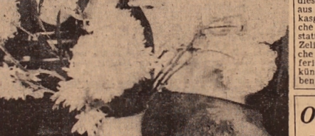
MOSKAU. Die Volkstänzerin der UdSSR Natalja Bessmertnaja... Ballett- und Tanztheater der UdSSR...