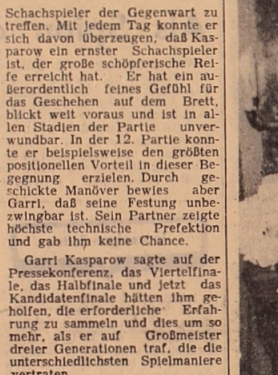
Garri Kasparow sagte auf der Pressekonferenz... das Halbfinale und jetzt das Kandidatinnenfinale...