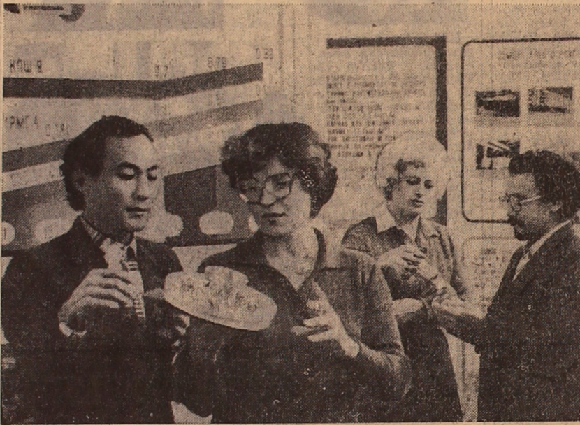
In der Verwaltung „Zelinograd“ von Zelinograd verläuft die Republikausstellung von Ausstellungen und Massenbedarfsgütern, gefertigt aus Abfallstoffen in verschiedenen Gebieten Kasachstans. Die Ausstellung zählt mehr als 1200 Exponate und verläuft unter dem Motto „Wirtschaftliche Wirtschafsführung“.

Diplomand des Unionsfestivals des politischen Liedes, das Gesangsensemble der Karagandaer staatlichen Universität, weihte mit Konzerten bei den Landwirten des Gebiets Kustanai. Diese Reise wurde vom ZK des Komsomol Kasachstans organisiert und verlief mit Erfolg.