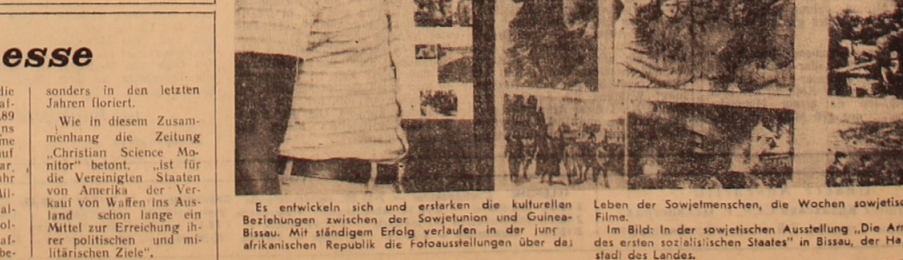
Es entwickeln sich und erstarben die kulturellen Beziehungen zwischen der Sowjetunion und Guinea-Bissau...