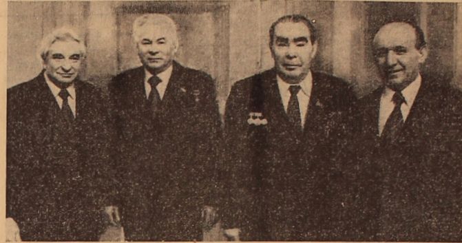
Während des Treffens im ZK der BKP.