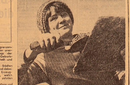
In der Stuckarbeiterbrigade der...