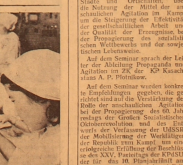
Die Arbeiter der Dienstleistungsbetriebe des Gebiets Aktjubinsk studieren mit großer Aufmerksamkeit den Entwurf der neuen Verfassung der UdSSR...