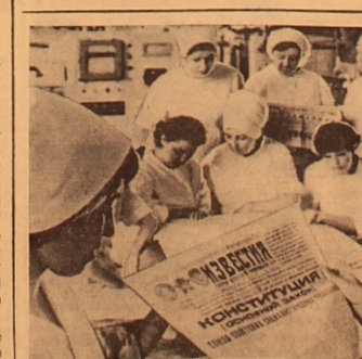
Das Kollektiv der Alma-Atar den Leninorden tragenden Produktionsvereinigung der Milchindustrie ebenso wie das ganze Sowjetvolk hat mit warmer Billigung den Entwurf der neuen Verfassung der UdSSR entgegengebracht...