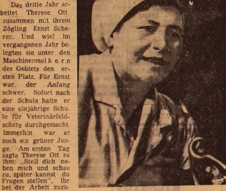
Ein geregelt Leben, ein gut organisiertes Dienstleistungssystem gewährleistet eine bessere Wiederherstellung der physischen und geistigen Kräfte...