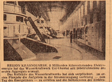
REGION KRASNOJARSK. 8 Milliarden Kilowattstunden Elektroenergie hat das Wasserkraftwerk Ust-Chantal seit Inbetriebnahme des ersten Aggregats erzeugt.

Die ersten Kubikmeter Beton wurden für das Fundament der Erdölpumpe bei der Siedlung Jurgamysch gelegt, die auf der Brücke der neuen Hauptarterialleitung Nishnewatrowsk—Kurgan—Kubyschew liegt. Nach vor kurzem wären für die Errichtung solcher einer Station etwa zwei Jahre nötig gewesen. Das Kollektiv des Truists „Uralneftegasstroj“ verpflichtete sich, das Objekt vorfristig — schon im dritten Quartal laufenden Jahres — seiner Bestimmung zu übergeben. Dieses Tempo wird durch die fortgeschrittenen Methoden der Bau- und Montagearbeiten erzielt werden. Es wurden