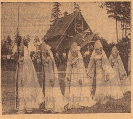
UNSER BILD: Der Frühlingsregen