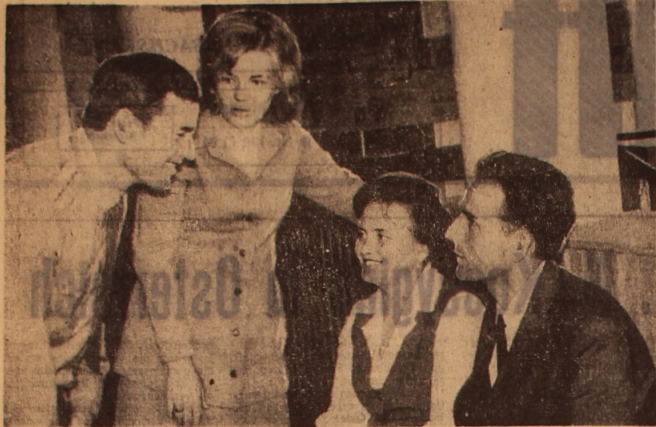
Im Zelinograd Gebietshaus für politische Schulung fand ein feierlicher Abend statt, auf dem 200 Abgängern der Abenduniversität für Marxismus-Leninismus-Diplome eingehändigt wurden...