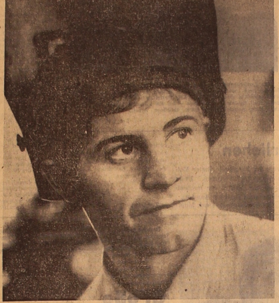
Gute Leistungen erzielt auf der Arbeitswacht zu Ehren des 50. Gründungstags der UdSSR...

Die Roten Wanderfahnen und ersten Geldprämien der Unionsvereinsung „Sowjuschelochotechnika“ und des ZK der Gewerkschaft wurden den Werktätigen der Rayonvereinsung „Kasseloschotechnika“ von Kurlai, Gebiet Dshambul, der Rayonvereinsung „Kasseloschotechnika“ von Shanaarka, Gebiet Karaganda, der Pawlodar Spezialisierten Mechanisierten Wanderkolonne, Gebiet Pawlodar, des Pawlodar Autotransportbetriebs, Gebiet Kustanai, und der Pawlodar Gebietshandelsniederlassung „Kasseloschotechnika“ zuerkannt.