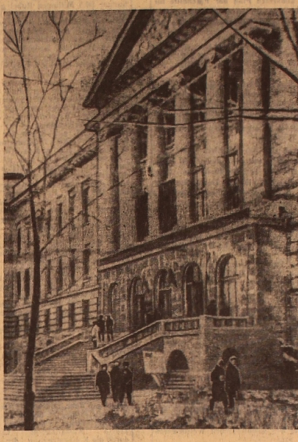
UNSER BILD: Hauptgebäude des Nowotscherkassker Polytechnischen Instituts