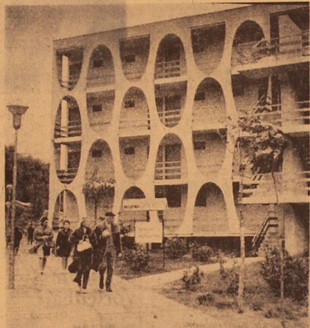
UNSER BILD: Der Kurort 'Abena'