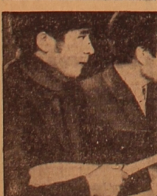
In der Zelinograd landwirtschaftlichen Hochschule sind viele Studenten in den Laienkunstzirkeln beschäftigt. UNSER BILD: Das Dombristenensemble während einer Probe.