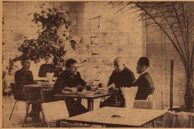
KARAGANDA. In der Grube Nr. 35, eines Kollektivs der kommunistischen Arbeit, wurde unlängst für die Bergleute ein Sanatorium-Vorbereitungsstelle eröffnet.