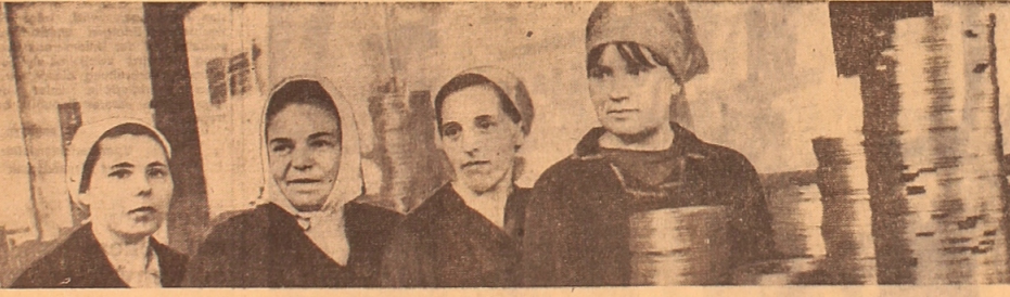
Im sozialistischen Wettbewerb, der zu Ehren des 100. Geburtstages von W. I. Lenin im Makinsker Werk namens W. I. Lenin entfaltet wurde...