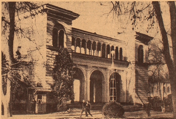
Der Haupteingang in den Erholungspark

Im den Jahren der Sowjetmacht wurden 20 Sanatorien neu gebaut