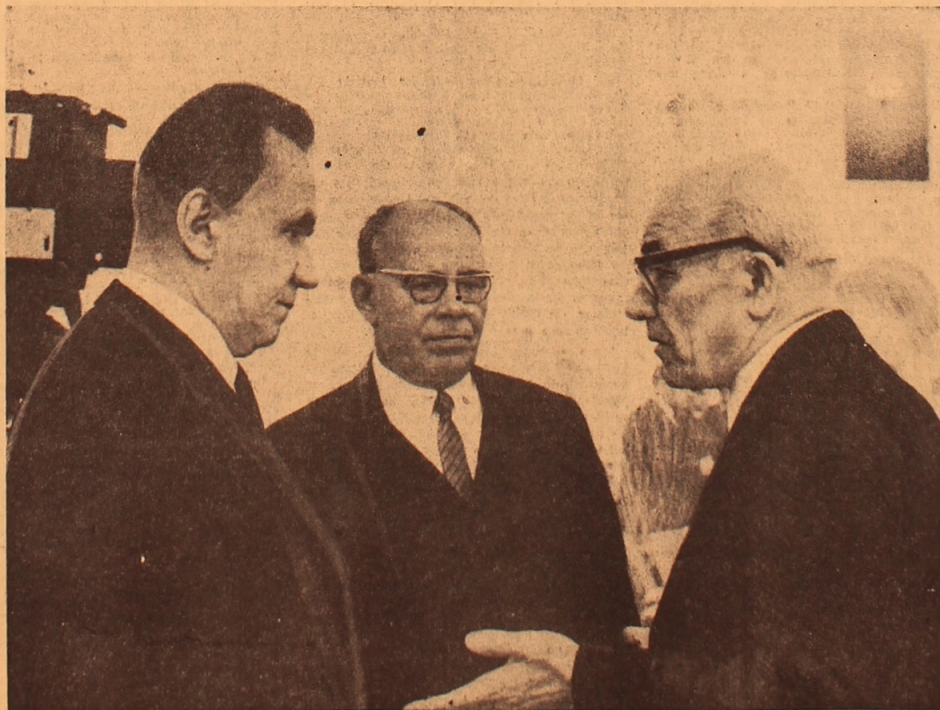
MOSKAU. Internationale Beratung der kommunistischen und Arbeiterparteien. UNSER BILD: Die Mitglieder der Delegation der KPdSU A. N. Kossygin und N. V. Podgorny unterhalten sich in einer Pause mit dem Ersten Sekretär des ZK der Polnischen Vereinigten Arbeiterpartei Wladislaw Gomułka.

Trotz des riesigen Aufwandes an Kriegstechnik war der amerikanische Imperialismus gezwungen, einer bedingungslosen Einstellung der Bombenangriffe auf die Demokratische Republik Vietnam zuzustimmen und mit den Vertretern der DRV und der Nationalen Front für die Befreiung Südvietnams zu verhandeln.